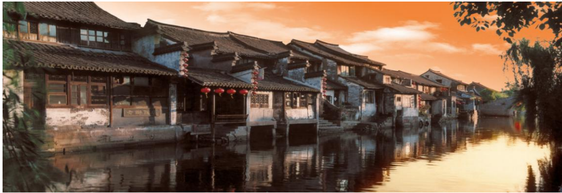
Đijasing | Sitang