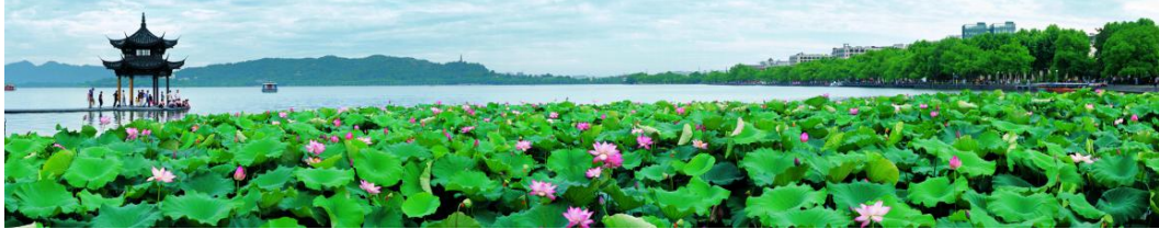
Hangdžou | Zapadno jezero