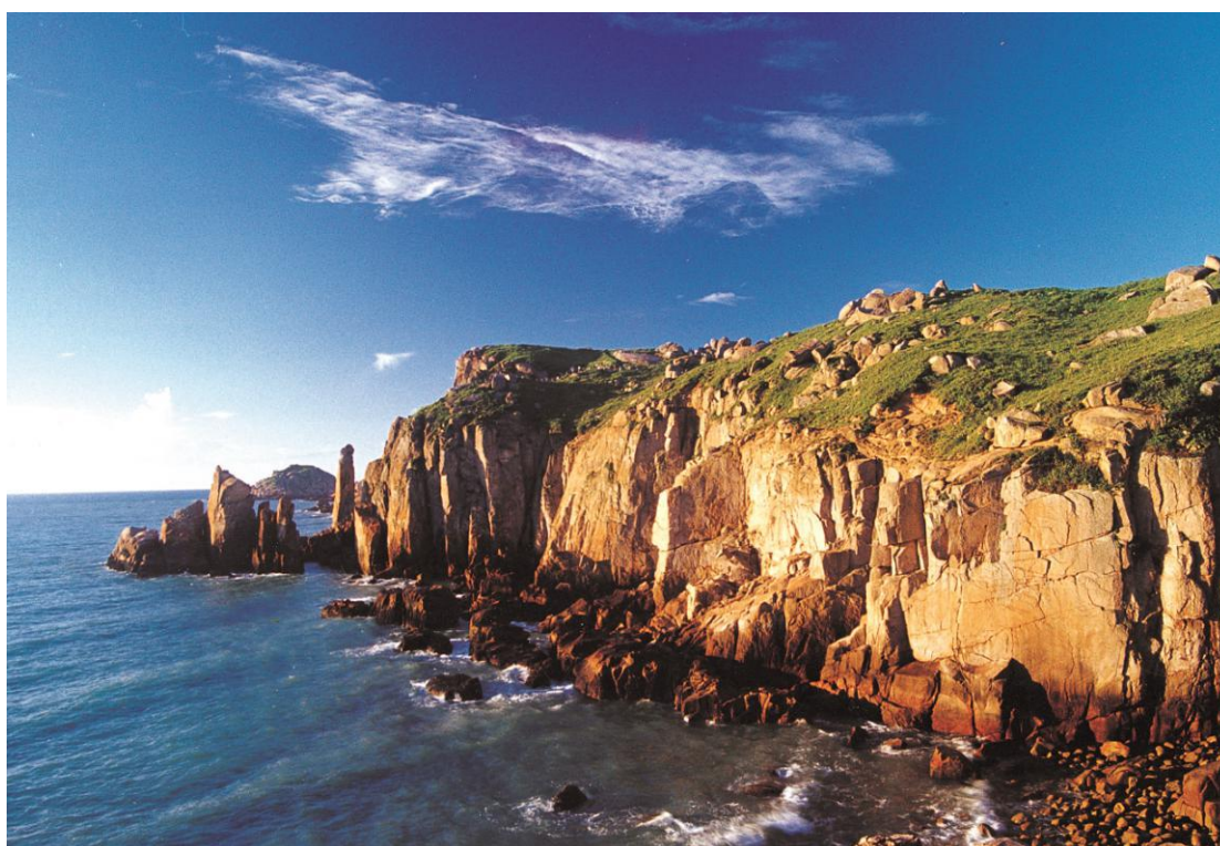
Vendžou | Nandi grupa ostrva