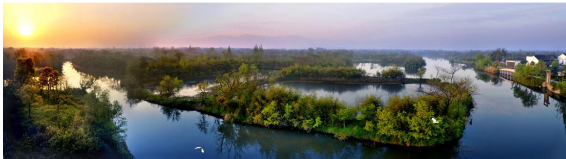
Hangdžou | Nacionalni park Sisi (Xixi)