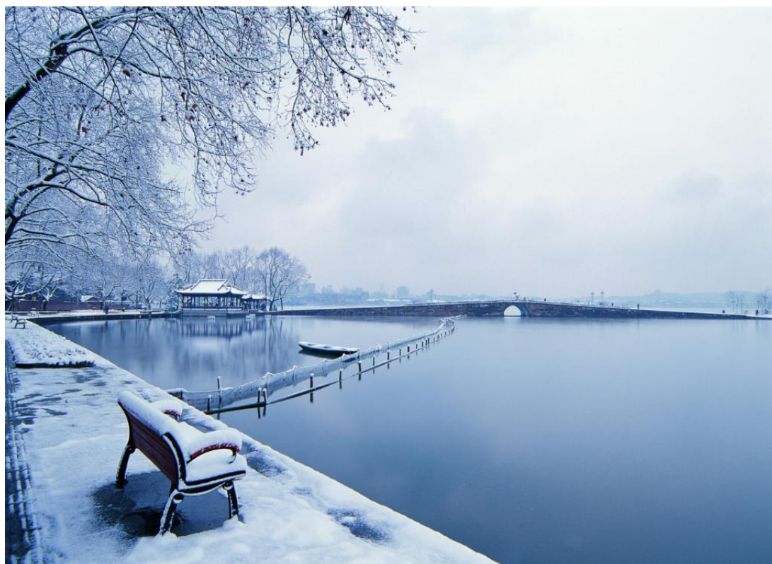
Hangdžou | Slomljeni most (Duanqiao /Duanćijao/) | Sneg koji se topi