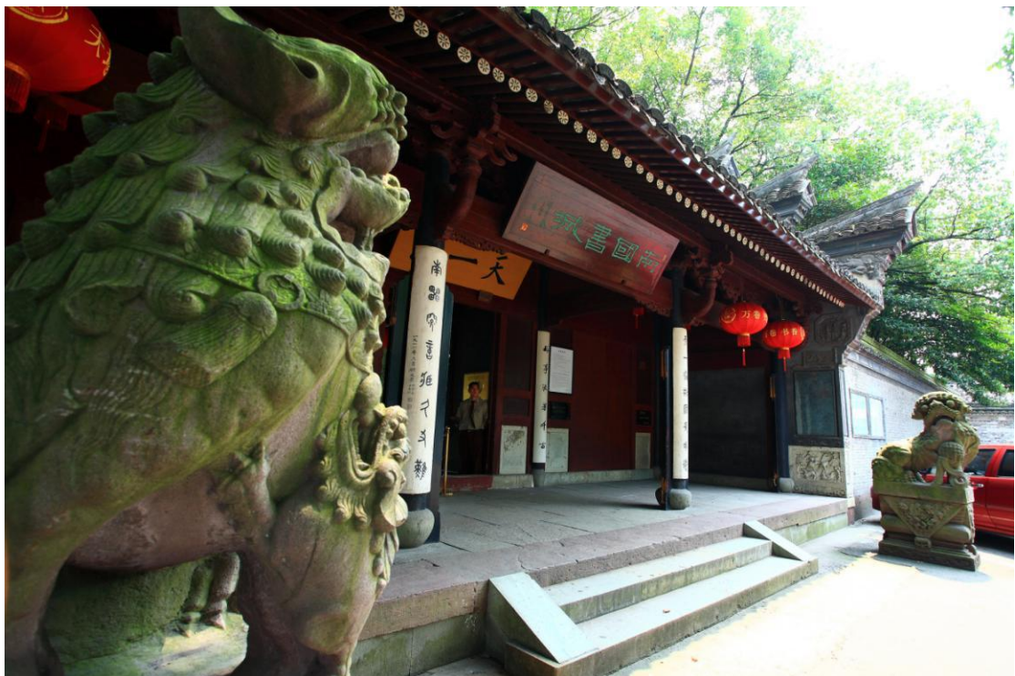
Ningbo | Nebeski paviljon (Tian Yi Ge /Tijenjige/)