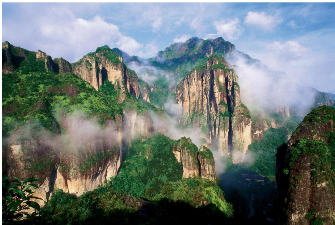
Vendžou | Planina Jendang