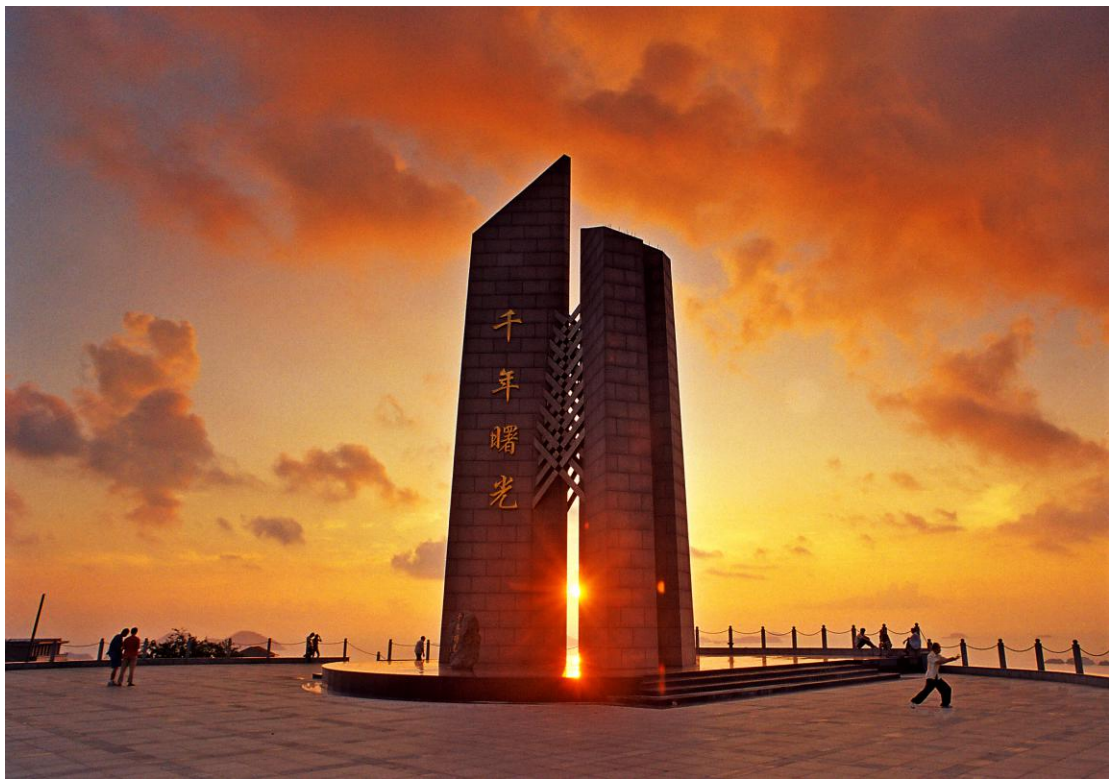
Taidžou | Park Milenijumska zora

(Qiannian Shuguang Yuan /Ćijennijen šuguang juen/)