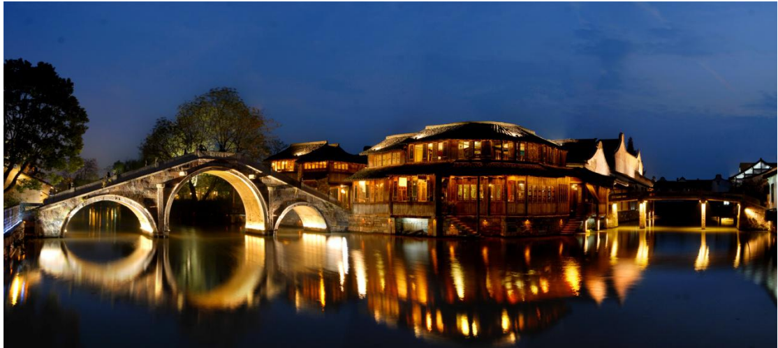
Dijasing | Vudžen