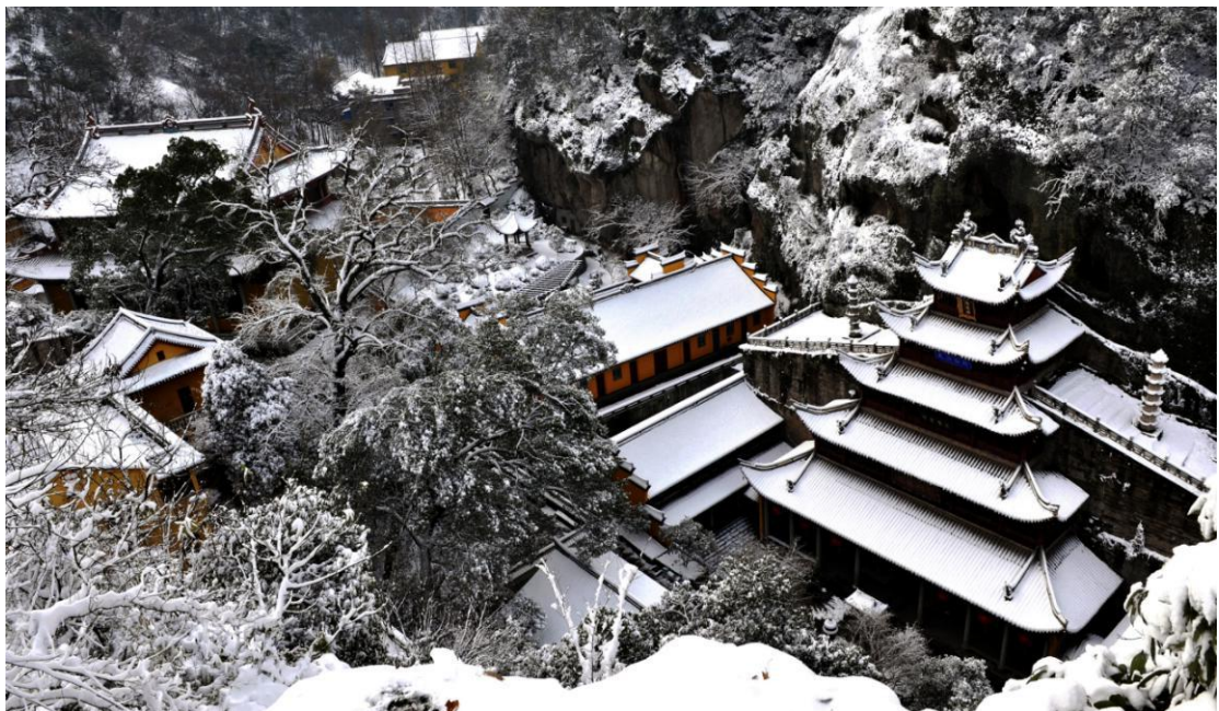
Šaosing | Hram Velikog Bude