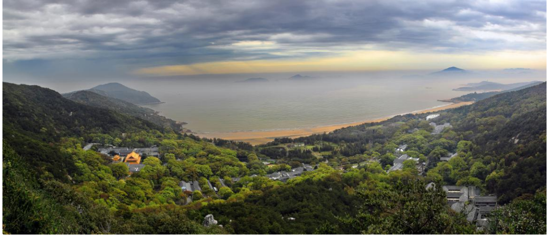
Džoušan | Planina Putuo